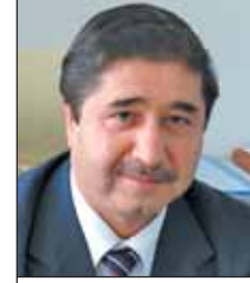
Türk Gemi nfla Sanayi