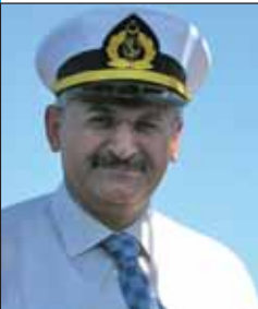
Binali Yıldırım Ulaştırma Bakanı;

"Hükümetimiz Döneminde Ülkemizin Yüzünü Denize Döndürdük"